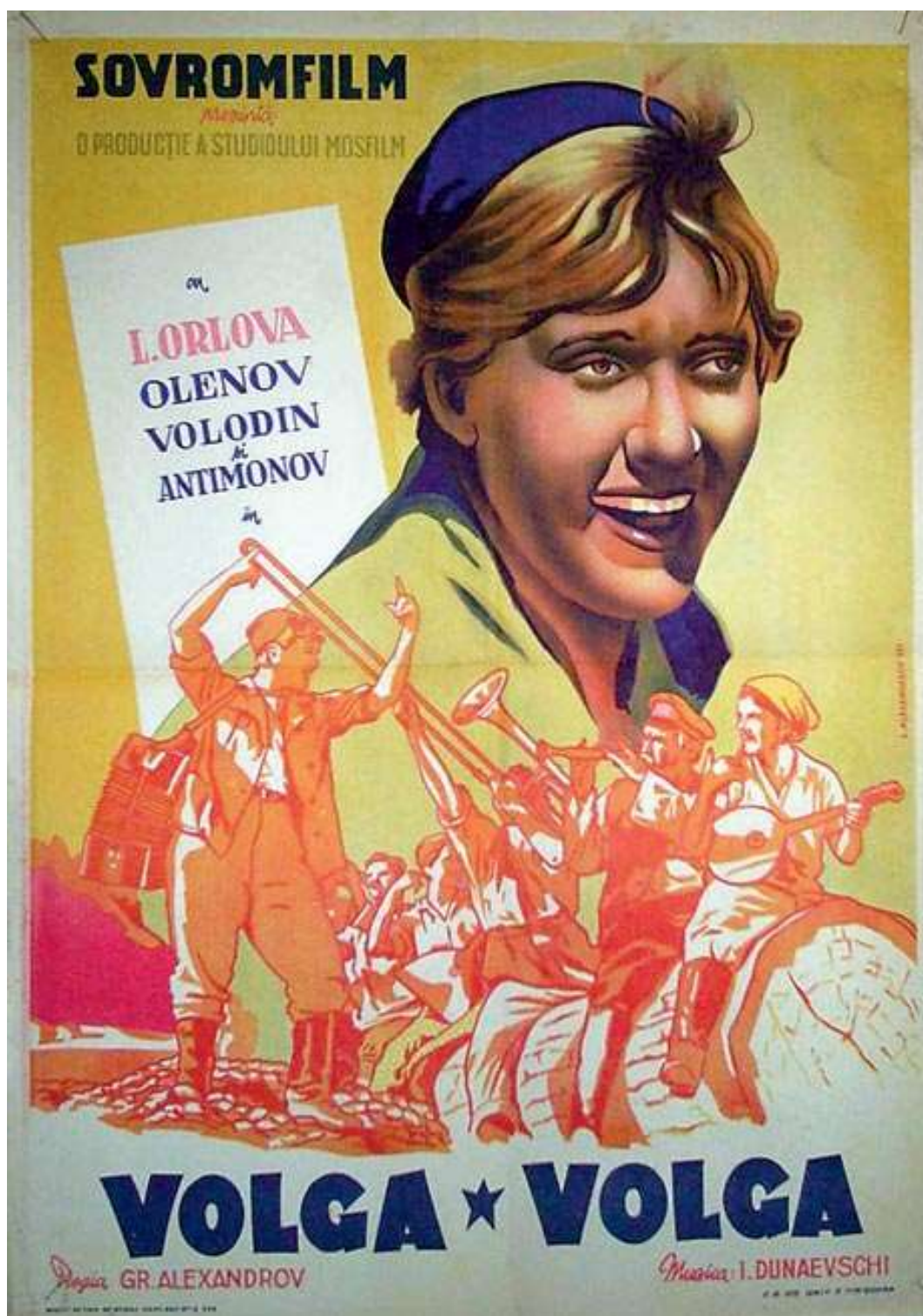
1946 – Первые полёты на реактивных самолётах МИГ-9 и Як-15